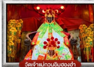
วัดเจ้าแม่กวนอิมสองอ่า