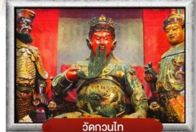
วัดกวนโก